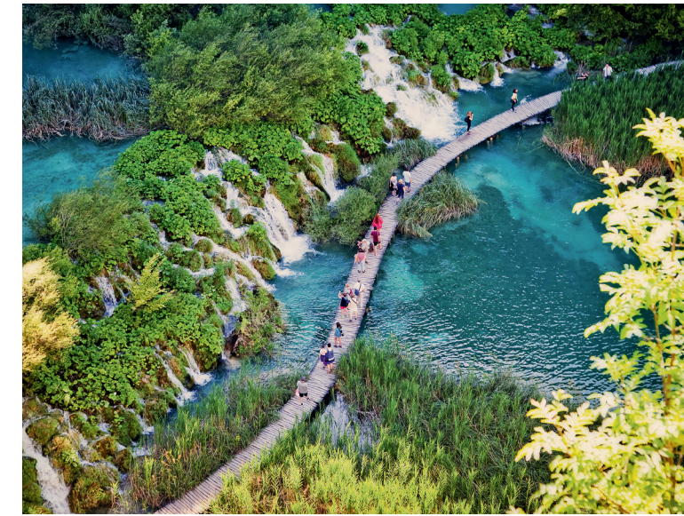
Einfach spektakulär sind die 16 über Kaskaden verbundenen Plitvicer Seen.

landschaften und wilden Wasserrutschen. Viele Campanganlagen sind mit Hotels und Marinas zusammengeschlossen, wodurch sich die Palette der Urlaubsaktivitäten noch erweitert. Auch die Auswahl von Mietun-terkünften ist groß und nimmt stetig zu.