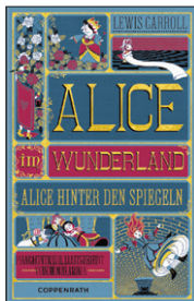
Lewis Carroll Alice im Wunderland – Alice hinter den Spiegeln 324 S., 34,00 € Coppentrath